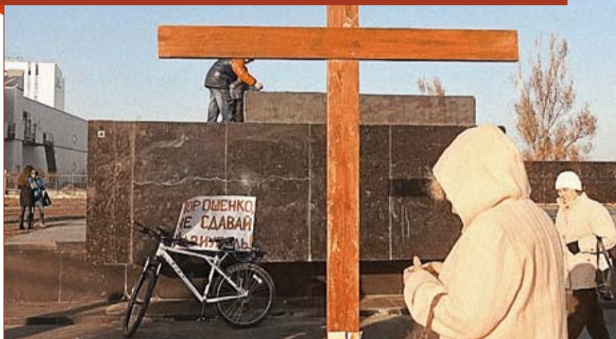
У серпні минулого року християни встановили в місті хрест замість поваленого пам'ятника Леніну. Його зламали. З того часу люди знову ставлять хрест, проте його знову ламають невідомі. Старе не хоче вмирати.

го літа, після трагедії в Іловайську, коли війська підійшли до Маріуполя, близько 70 відсотків парафіян покинули місто. Я з'ясував це під час йорданських відвідин осель парафіян. Багато вірних мобілізувалися, не менше виїхали до Львова і Тернополя. Ті, що залишилися, приходять на Богослужіння.