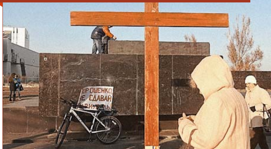
У серпні минулого року християни встановили в місті хрест замість поваленого пам'ятника Леніну. Його зламали. З того часу люди знову ставлять хрест, проте його знову ламають невідомі. Старе не хоче вмирати.

го літа, після трагедії в Іловайську, коли війська підійшли до Маріуполя, близько 70 відсотків парафіян покинули місто. Я з'ясував це під час йорданських відвідин осель парафіян. Багато вірних мобілізувалися, не менше виїхали до Львова і Тернополя. Ті, що залишилися, приходять на Богослужіння.