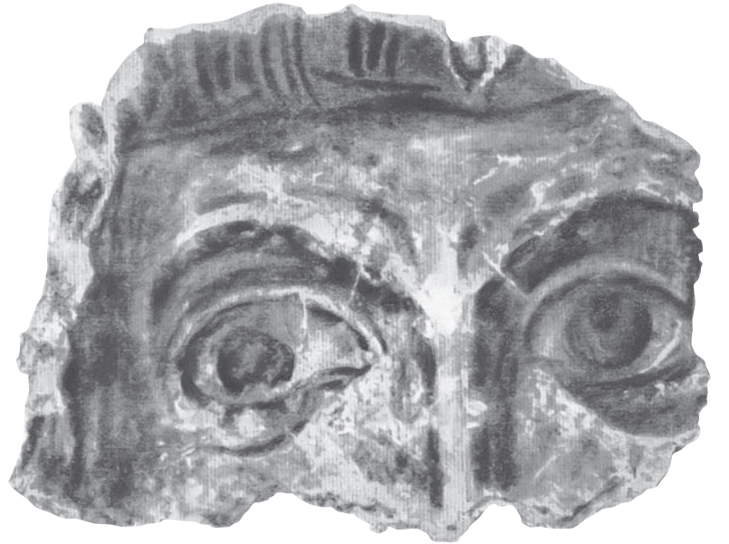
Фрагмент фрески з Десятинної церкви в Києві, кінець X ст.

Можна ще відмітити й інший факт – це саме оті теплі, плідні літні місяці, липень-серпень, в яких наша Українська Церква пошановує майже усіх отих святих мужів і жінок своєї початкової історії: «Дня 10 липня – преподобного отця нашого Антонія Печерського», начальника всіх руських ченців; а зараз таки на другий день, тобто «11 липня – блаженної княгині руської Ольги»; а далі, дня 24 липня – «святих мучеників-страстотерпців Бориса і Гліба», тобто двох улюблених синів Володимира; а коли йдемо ще далі, то під днем 14 серпня знайдемо «пам'ять перенесення чесних мощів преподобного отця нашого Теодосія, ігумена печерського». Всі вони – перші начальники українського християнства, які жили і діяли в світлі отого переломового факту української історії – хрищення 989 року. Їм віддає нарід вже майже з перших десятиліть по їхній смерті релігійну пошану-культ. Це отой «ореол», ота золотиста обідка на їхніх іконах, яка і визначає і позначає їхні земські портрети, вказуючи на них як на угодників Божих.