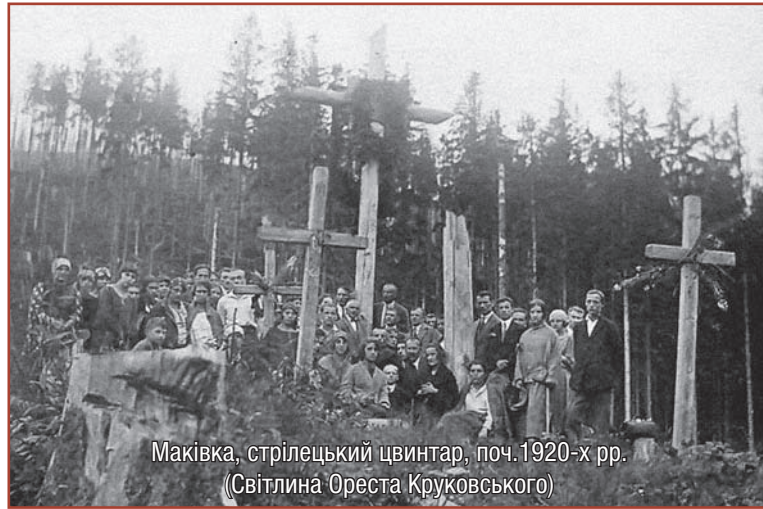
Маківка, стрілецький цвинтар, поч. 1920-х рр.