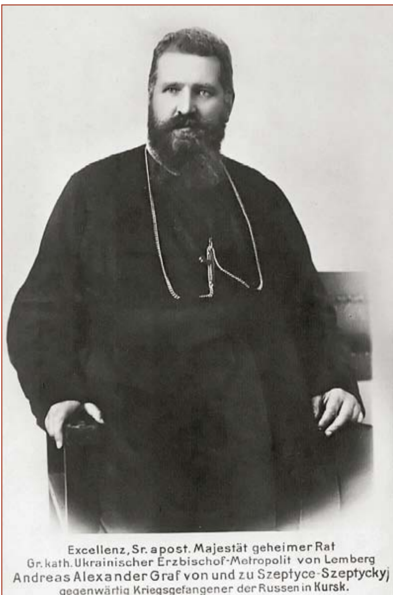
Excellenz, Sr. apost. Majestät geheimer Rat Gr. kath. Ukrainischer Erzbischof-Metropolit von Lemberg Andreas Alexander Graf von und zu Szeptyce-Szeptycky gegenwärtig Kriegsgefangener der Russen in Kursk.

◀ Митрополит Шептицький , зокрема, заснував Український Національний Музей, купив у 1905 р. для нього приміщення за 34000 доларів (з допомогою євреїв, бо поляк-власник не бажав продавати будинок українцям). Там зібрано одну з найбільших у Європі збірок іконопису. Був ініціатором і засновником Земельного Банку у Львові (1910 р.). Ним заснована Львівська Богословська Академія (в 1928 р. єдиний український вищий навчальний заклад за Польщею). За ініціативою Шептицького було засновано Львівську Греко-Католицьку Академію (1928 р.), Богословське Наукове Товариство (1929 р.), Український Католицький Інститут Церковного З'єднання ім. Митрополита Рутського (1939 р.). (з Вікіпедії)